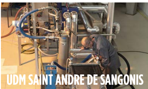
UDM SAINT ANDRE DE SANGONIS

Défi relevé ! la campagne d'extraction de couleurs Nous préservons notre environnement en renforçant notre système de traitement d'effluent, notamment par la réfection totale du bassin de décantation. Les inondations d'octobre ont mis à l'épreuve cette nouvelle installation, avec succès ! Parallèlement à ces efforts de dépollution, nous continuons à agir de façon importante sur les économies d'eau dans l'usine, avec l'installation d'un osmoseur couplé avec un circuit de recyclage.