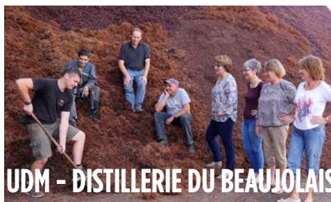
UDM - DISTILLERIE DU BEAUJOLAIS

L'été a porté ses fruits et c'est avec une salle de transformation flambant neuve que la campagne a recommencé, s'engageant toujours plus dans l'amélioration continue de nos conditions de travail !